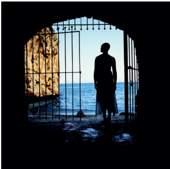
Isaac Julien, Western Union Series no. 1 (Cast No Shadow) , 2007. Duratrans beeld in lichtbox, 120 x 120 cm.

Versies van dit werk bevinden zich in museumcollecties waaronder die van het Buffalo AKG Art Museum in New York, Israel Museum in Jeruzalem, Kiasma Museum of Contemporary Art in Helsinki, Milwaukee Art Museum in Wisconsin en Museum Brandhorst in München, Helga de Alvear Collection.