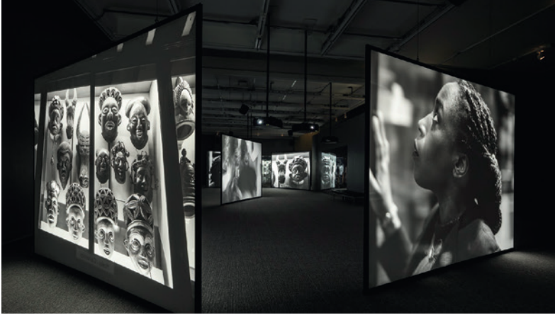
Installatie-overzicht, Once Again... (Statues Never Die) , 5-schermen, Barnes Foundation, 2022. Foto: Henrik Kam © Isaac Julien. Courtesy de kunstenaar en Victoria Miro