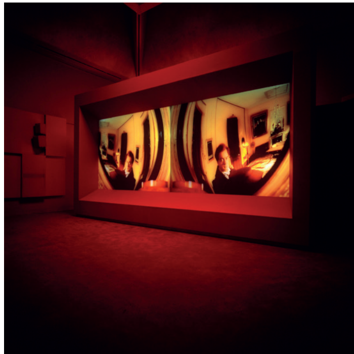
Installatie-overzicht, Vagabondia , Turner Prize, Tate Britain, 2001. Foto: Tate Photography. © Isaac Julien. Courtesy de kunstenaar en Victoria Miro

Europese, Britse en Noord-Amerikaanse musea functioneren van oudsher als plekken die geschiedenis en cultuur herbergen en definiëren. Maar objecten staan voor geschiedenissen die zich door tijd en ruimte hebben verspreid, en daardoor nog maar één bepaald cultureel narratief vertellen. Historische feiten worden weggelaten en verhalen raken vaak vervormd, afhankelijk van welke objecten worden verzameld en door wie. In Juliens handen wordt het permanente karakter van het museum opgeheven: hij zet de geschiedenis in beweging terwijl hij de grenzen van tijd en ruimte vervaagt en dikwijls doorbreekt. Julien nodigt ons uit om ons af te vragen 'wie wat ziet en wat we eigenlijk zien'. Musea zijn vaker een thema in zijn werk. Hij onderzoekt hun soms gewelddadige geschiedenissen en reflecteert op wat een museum vandaag de dag zou moeten zijn: hoe kunnen ze objecten verzamelen, tonen en delen en hoe willen we met die objecten in contact komen?