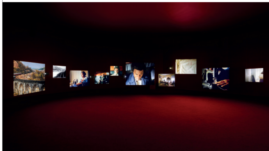
Installatie-overzicht, Lessons of the Hour , 10-schermen, Tate Britain, 2023 Foto: Jack Hems. © Isaac Julien. Courtesy de kunstenaar en Victoria Miro

Versies van dit werk bevinden zich in museumcollecties waaronder die van het Bonnefanten in Maastricht, Memorial Art Gallery in New York, Museum of Modern Art in New York, Virginia Museum of Fine Arts in Virginia en het de Young Museum in San Francisco.