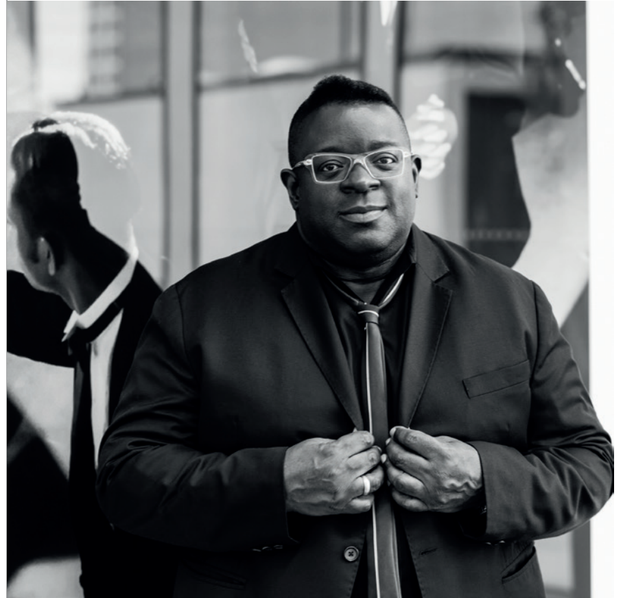
Isaac Julien.

De tentoonstelling is door Julien opgezet als een vloeiende ruimte die de 'mobiele toeschouwer' stimuleert om de werken in zijn of haar eigen tempo te ervaren. Al lopend langs de installaties met meerdere schermen, kun je zo verschillende perspectieven ontdekken en zelf bepalen hoe je Juliens filminstallaties en kunstwerken ondergaat.