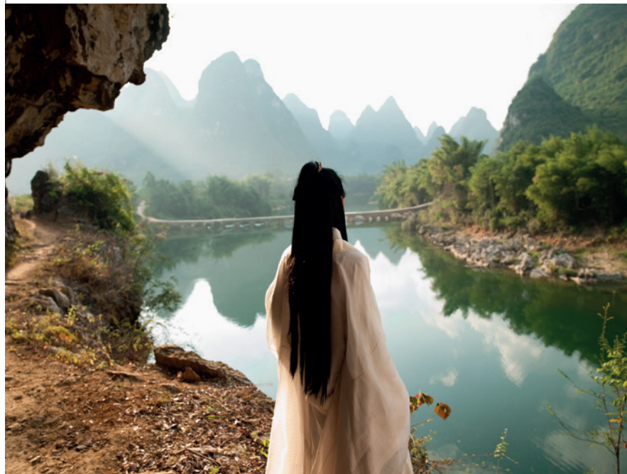
Isaac Julien, Mazu, Silence (Ten Thousand Waves) , 2010, Endura Ultra foto, 180 x 239,8 x 7,5 cm.

Versies van dit werk bevinden zich in museumcollecties waaronder die van het SF MoMA in San Francisco, de Fondation Louis Vuitton in Parijs, M+ in Hong Kong, Museum of Modern Art in New York, Nasjonalmuseet in Oslo, Towner Art Gallery in Eastbourne, The Whitworth in Manchester en Zeitz Museum of Contemporary Art Africa in Kaapstad.