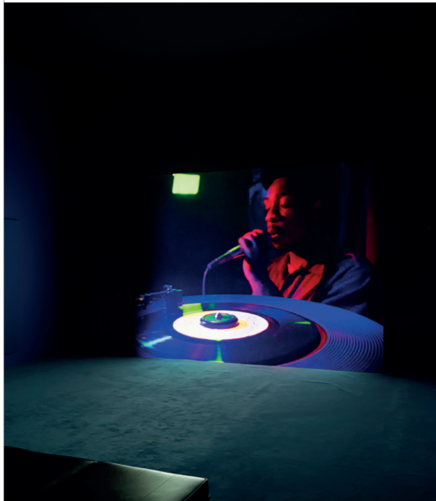
Installatie-overzicht, Territories , Life Between Islands tentoonstelling, Tate Britain, 2021.

Dit werk bevindt zich in museumcollecties waaronder die van het Centre Pompidou in Parijs en het Museum für Moderne Kunst in Frankfurt.